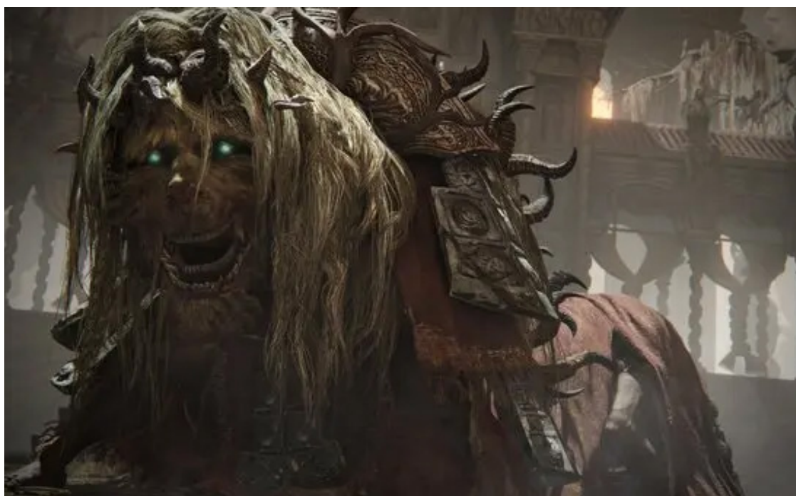
Jogo é vitória da desenvolvedora FromSoftware

chefes, novas armas, magias e armaduras e, principalmente, a promessa de responder questões prementes da história que ficaram sem explicação.