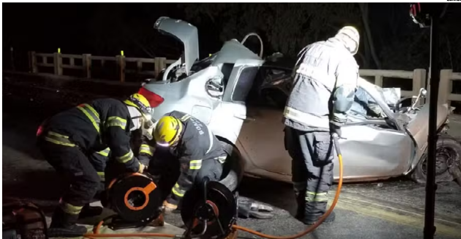
Devido à gravidade do ocorrido, a BR-040 precisou ser completamente interditada

Devido à gravidade do ocorrido, a BR-040 precisou ser completamente interditada para permitir o trabalho das equipes de emergência e garantir a segurança dos demais motoristas. A interdição da rodovia gerou congestionamentos significativos e atrasos para aqueles que transitavam pela