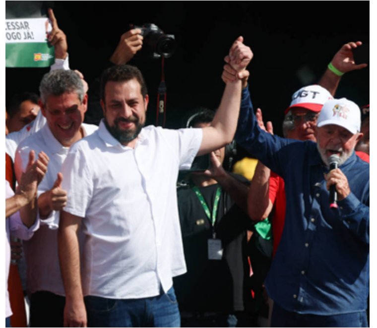
Lula Silva e Guilherme Boulos: influência nas eleições municipais, de olho na reeleição em 2026

Após as derrotas, o deputado José Guimarães (PT-CE), líder do governo na Câmara, disse a correligionários em