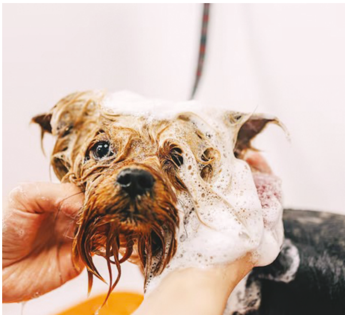
Orientação se adequa ao modo de vida, aos hábitos e à saúde do animal

“A orientação correta faz com você tenha menos prejuízos mais para frente, tem muita gente gastando dinheiro à toa, sendo que não precisava ser dessa forma. Se você procurar um profissional e tiver a orientação correta, você vai economizar muito mais lá na frente”, concluiu o médico veterinário.