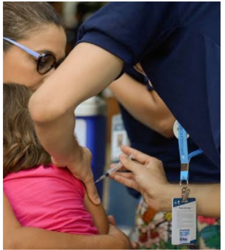
Ministério da Saúde emitiu nota que recomenda ações de vigilância da doença como a vacinação

Em maio deste ano, a União Europeia divulgou um Boletim Epidemiológico mostrando aumento da doença em pelo menos 17 países.