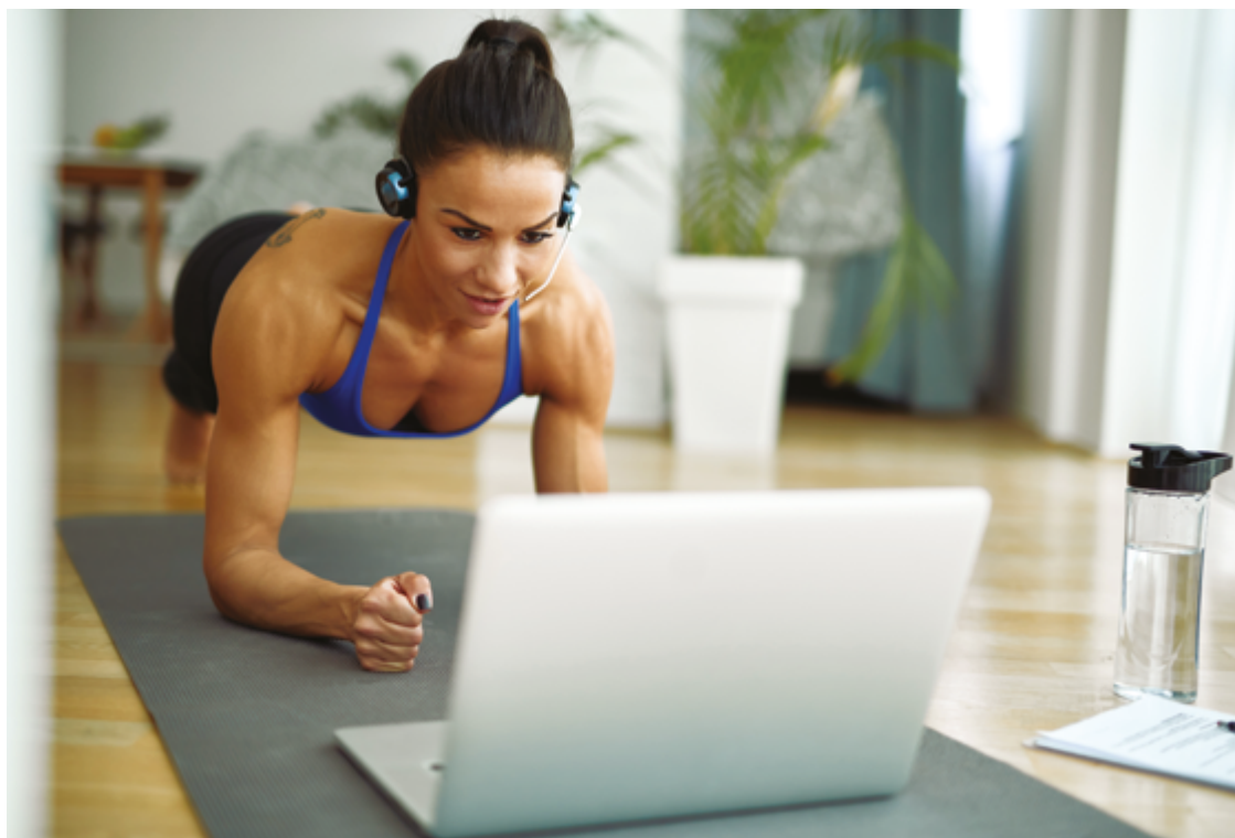
Orientações online com treinadores físicos permitem que, mesmo sob rotina pesada, sejam encaixadas atividades

Nas consultorias online, conforme afirma Leão, o profissional de Educação Física realiza uma avaliação com o aluno antes de montar a prescrição de treino, que costuma ser organizada em planilhas ou tabelas. “Para obter bons resultados, o aluno deve ter um conhecimento básico sobre os exercícios escalados na prescrição ou contar com a orienta-