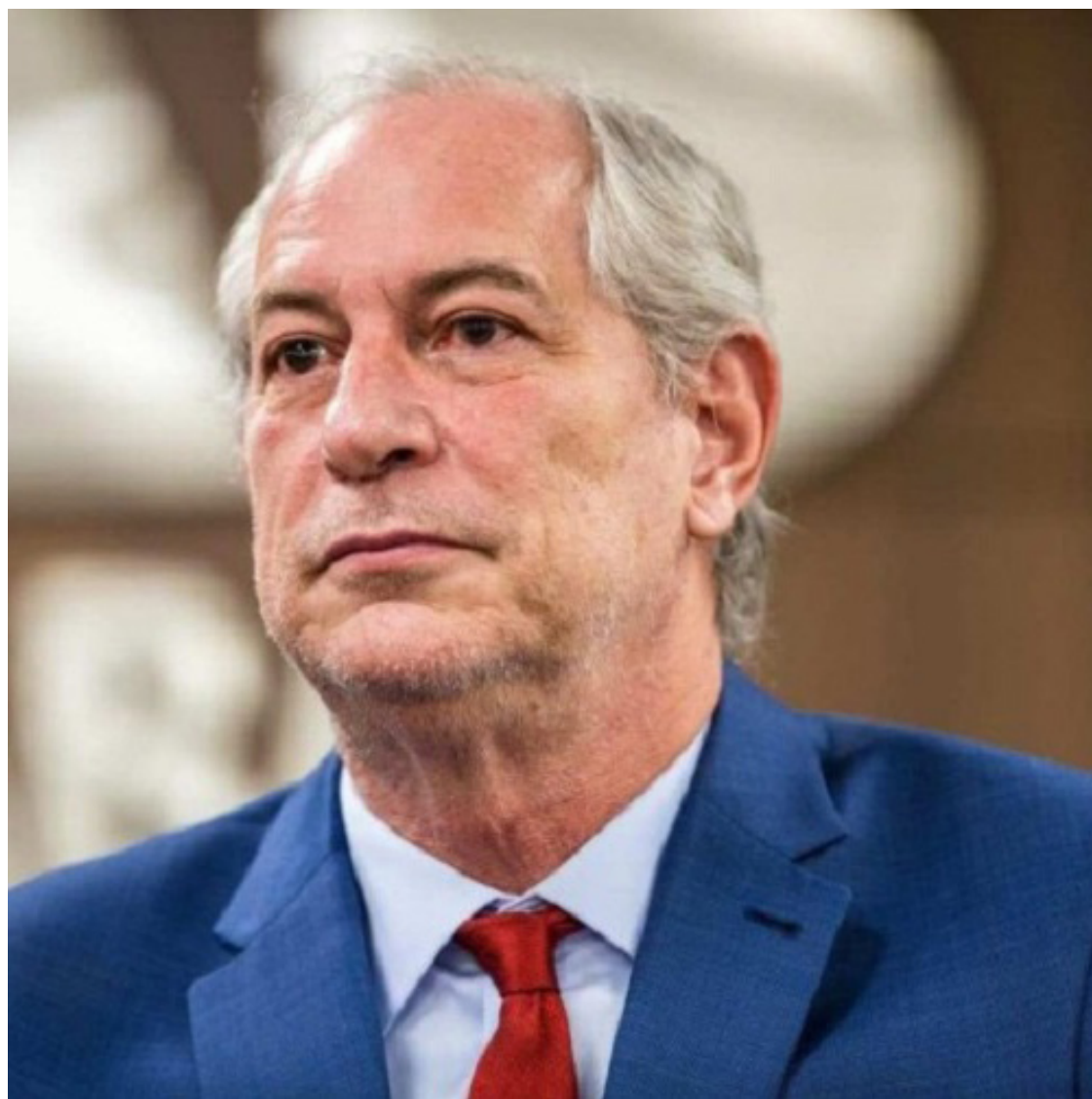
Ciro Gomes: Ronaldo Caiado tem trajetória política e experiência em gestão pública

O político cearense também criticou o comportamento da primeira dama Janja da Silva e diz que o “janjismo”, termo