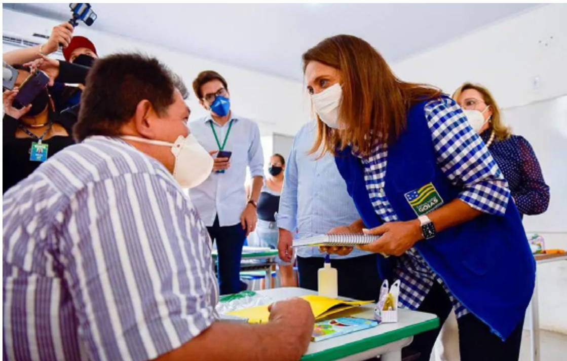
Na região do Entorno, cinco cidades estão em diferentes fases de formação: Águas Lindas, Luziânia, Planaltina de Goiás, Formosa, Novo Gama

Na região do Entorno, cinco cidades estão em diferentes fases de formação: Águas Lindas, Luziânia, Planaltina de Goiás, Formosa, Novo Gama. “Alfabetizar é o primeiro passo para dar dignidade à população. Não estou falando apenas de conseguir incluir essas pessoas no mercado de trabalho, mas deixar a vida mais operacional. Por exemplo, poder ver o preço