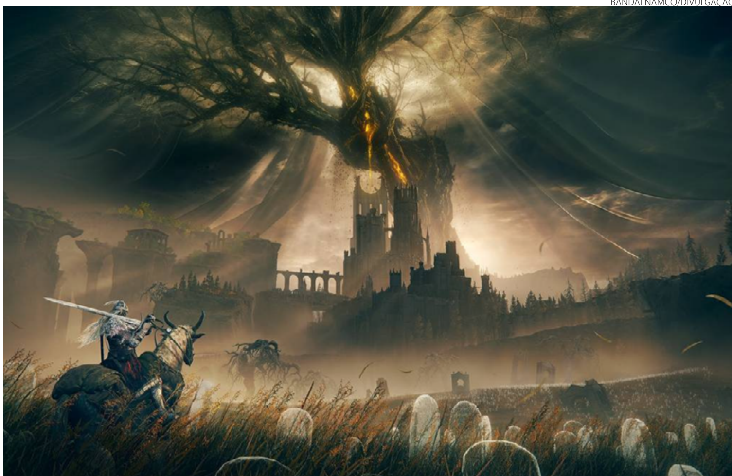
‘Shadow of the Erdtree’ mostra dimensão paralela onde se passa a trama da expansão

Para além disso, “Shadow of the Erdtree” cativa o jogador acostumado com “Elden Ring” porque tem a seu favor novos