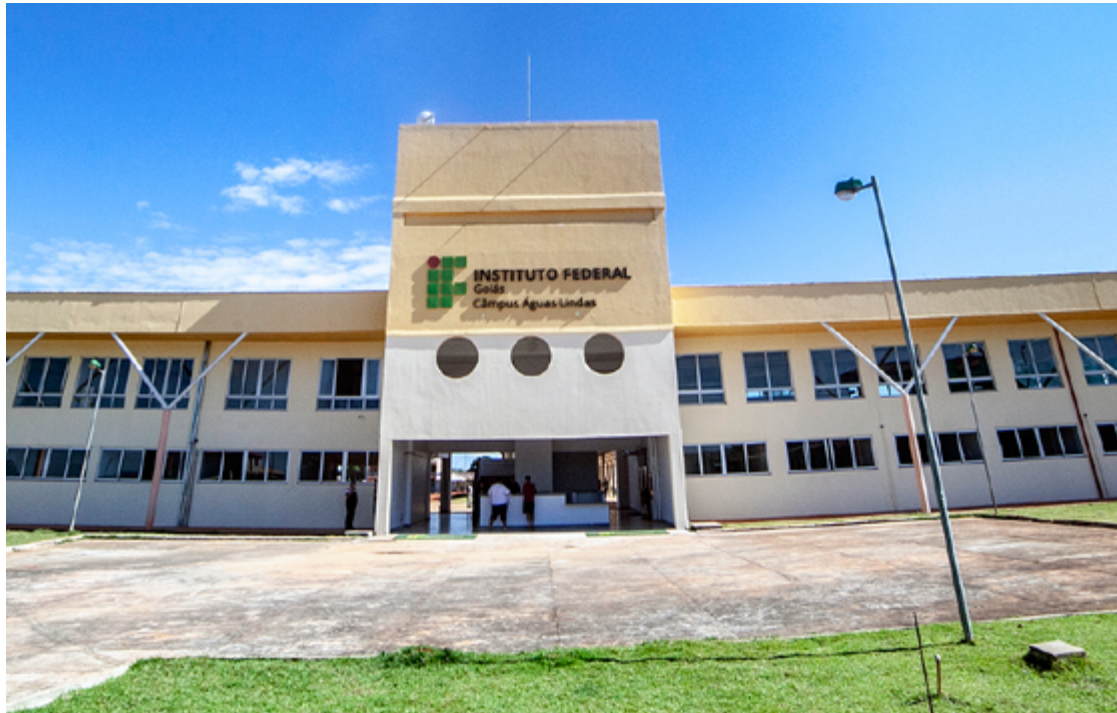
A implementação desta UBS no campus Águas Lindas é extremamente vantajosa para a formação dos estudantes e para a comunidade