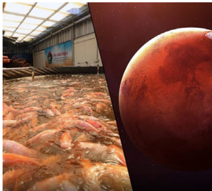
Exploração espacial e a colonização de Marte apresentam desafios

A exploração espacial está em constante evolução, e a busca por soluções inovadoras para a produção de alimentos em Marte é um passo crucial