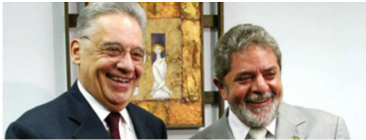
Fernando Henrique e Lula: aproximações e estremecimentos