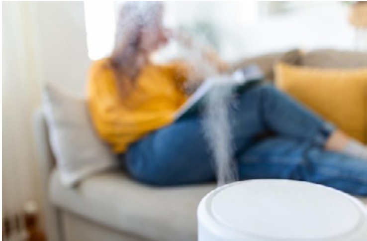
Uso de umidificador ajuda a reduzir os efeitos da desidratação causada pelo tempo seco