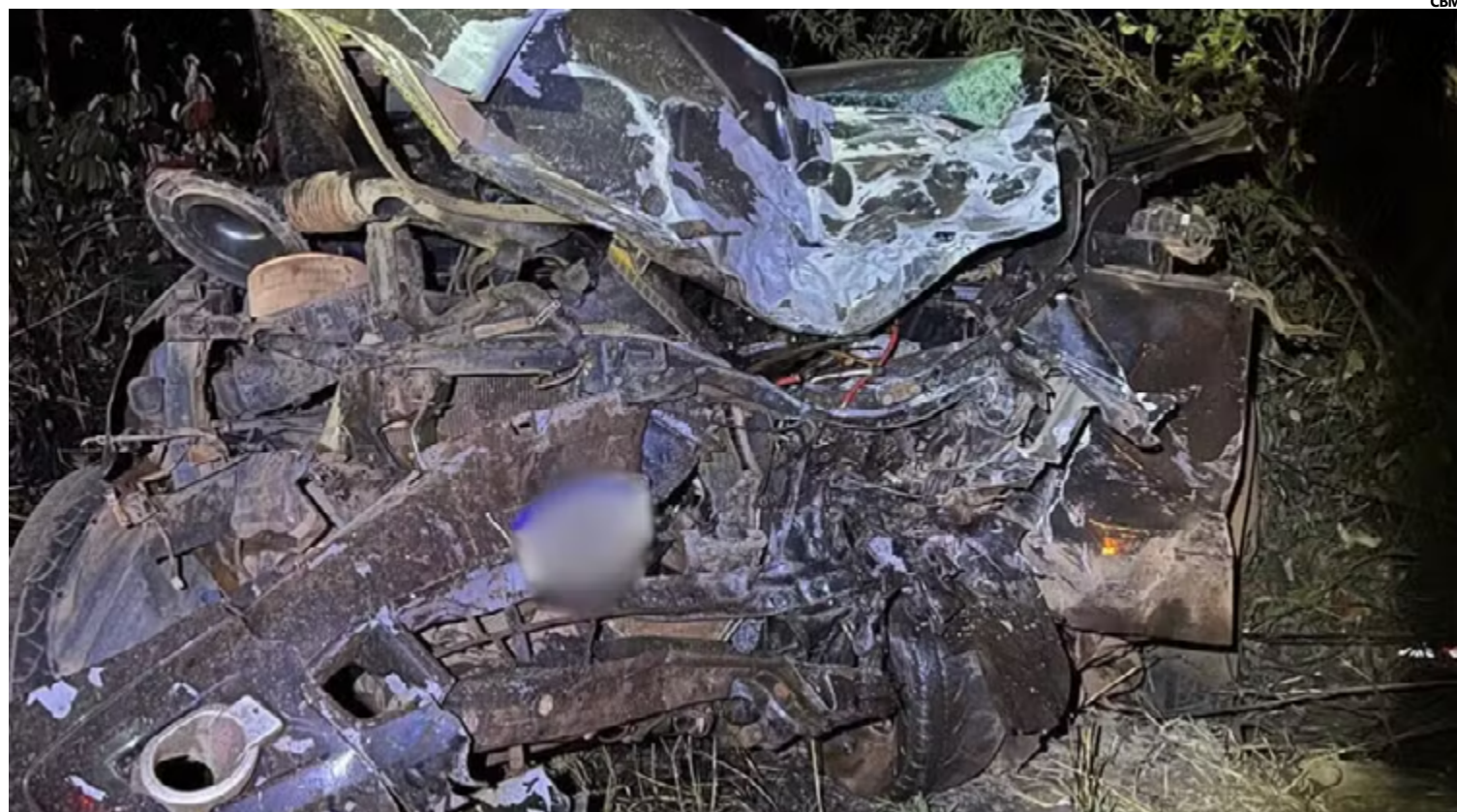
A cena do acidente foi isolada pelas autoridades para permitir o trabalho das equipes de emergência e a remoção dos veículos

Um terceiro veículo, que trafegava atrás da caminhonete, também esteve envolvido no aci-