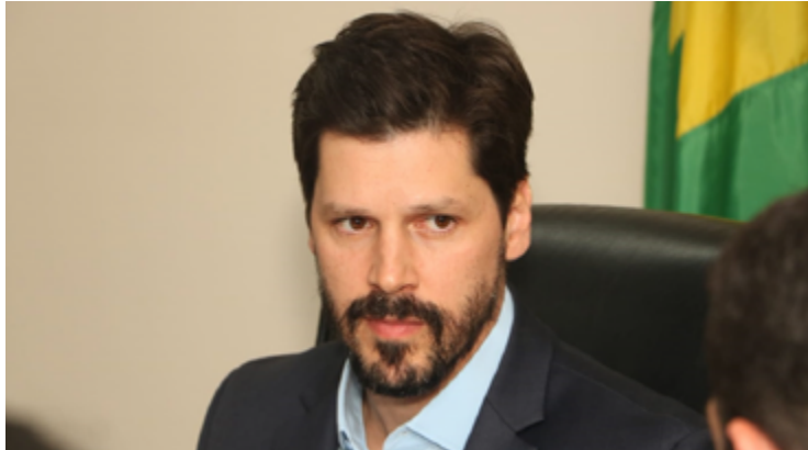
Daniel Vilela à frente do governo de Goiás